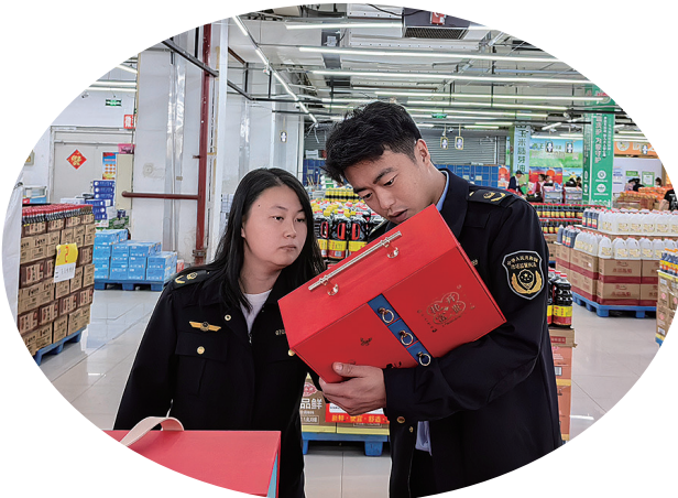
春节将至，蛟河市市场监督管理局聚焦保供稳价、民生消费、安全稳定等重点领域，扎实开展节前专项检查，筑牢市场监管领域安全防线。

动，以更高的水准为旅客服务。 在开往各地的列车上，随处可见民警忙碌的身影，他们穿梭在人群中，为旅客提供帮助，使他们倍感温馨；有的民警帮助行动不便的旅客搬运行李，开辟绿色通道；有的民警为旅客发放反诈宣传传单，增强防范意识，还有的民警在列车上开展巡逻防控，维护车厢内治安秩序，保护旅客平安畅达。