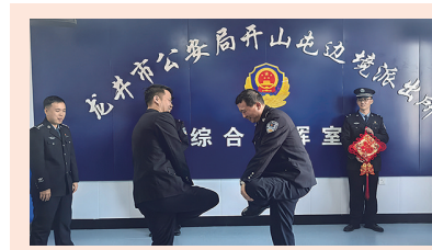
近日，龙井市开山屯边境派出所组织民警开展警营文化活动。

中心提供全方位的支持与培训，从网约车服务规范、驾驶安全知识到平台操作技巧等，助力新手司机快速适应行业要求；对于有经验的司