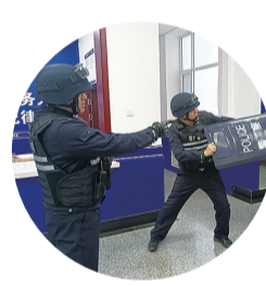
近日,延边边境管理支队图们大队红光边派出所开展警情处置演练。

泉阳镇将继续保持积极进取的态度,不断完善招商政策,提高服务质量,以更加务实的作风和更加有力的举措,推动招商引资和项目建设工作取得新的更大突破。同时,泉阳镇将进一步加强与企业的沟通合作,倾听企业的需求和建议,不断优化营商环境,为企业的发展提供更加优质的服务和更加广阔的空间。