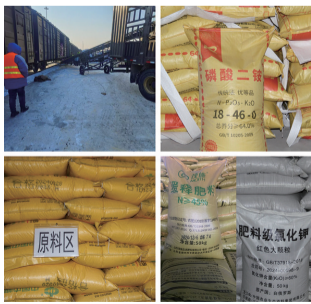
生产到应用的全方位服务。

公司旗下的自主商标品牌“鑫久强”,凭借其卓越的产品性能和稳定的产品质量,在市场上赢得良好的口碑。公司不仅提供高品质的农业肥料,还免费为农户提供技术指导,帮助他们科学施肥,提高农作物产量和品质,真正实现了从