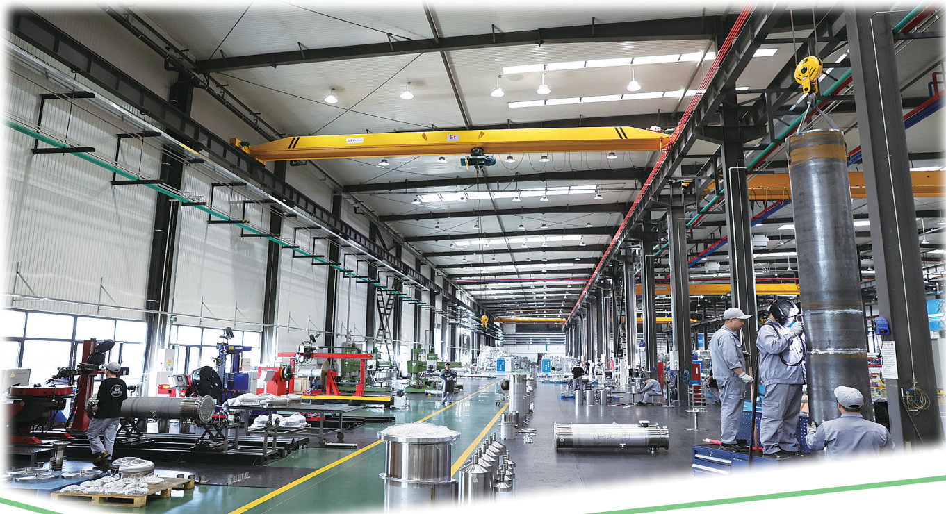
楚天华通医药设备有限公司生产车间

年初以来,长春市九台区招商引资工作立足“一区引领,双链驱动,三镇换新,四大提升”整体发展格局,紧扣“双链”发展目标任务,扎实开展招商引资攻坚行动,全力推动招商引资提速扩量增效,招商引资工作取得可喜成绩。1-6月份,全区新签约亿元以上合同类产业项目43个,累计到位内资163.87亿元。