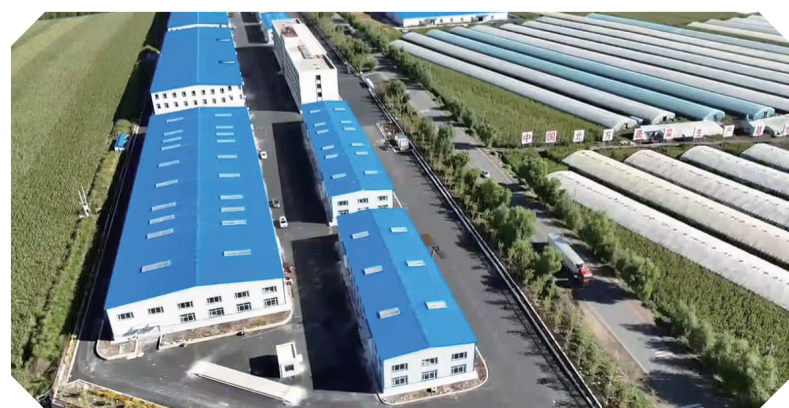
即将投入使用的八号镇北沟村蔬菜交易中心

榆树市县域经济高质量发展势头强劲,数据显示:上半年,榆树市推动55个5000万元以上重点项目开复工,签约了永莱农贸冷链预制菜综合产业园等18个超亿元项目,提前完成了全年签约目标任务。