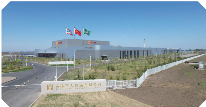
不断打造封闭式产业链条的吉林正大食品有限公司